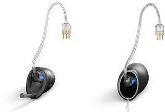
유니버설 슬림팁 AV 티타늄 슬림팁 AV